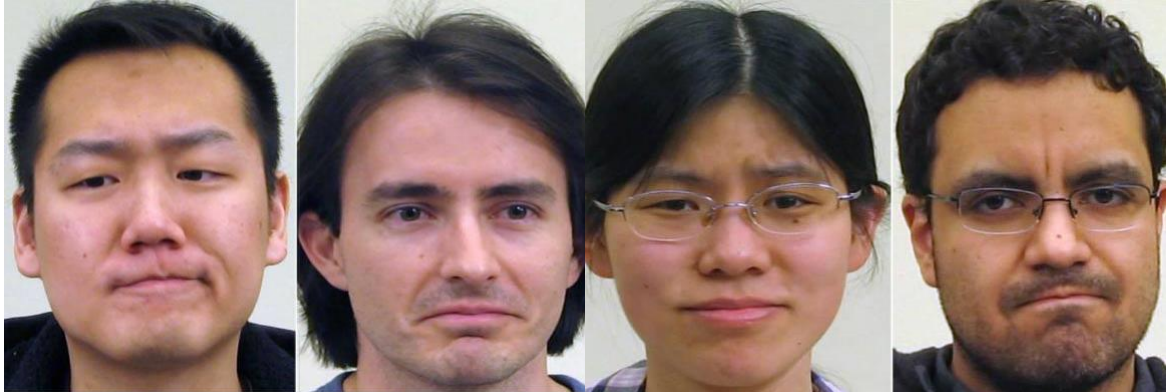
‘Not’ faces.