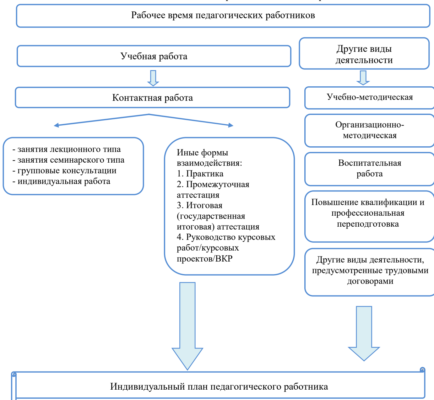
Схема 1. Рабочее время педагогических работников

2. Схему 1 из раздела III «Общие положения» изложить в следующей редакции: